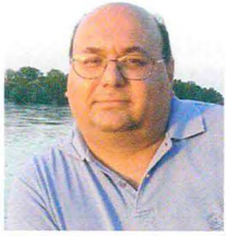
di Antonio Lecci

In tilt le comunicazioni per un guasto alla rete TIM di Parma